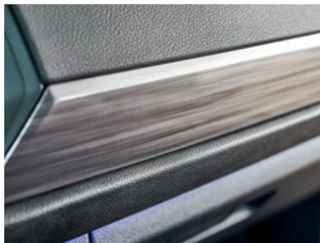
Sliced Metal Brush