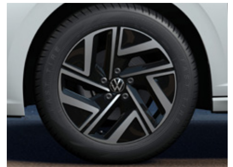
7J x 17" alloy wheels 205/55 R17 tyres