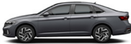
Platinum Gray Metallic