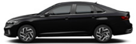
Deep Black Pearlescent